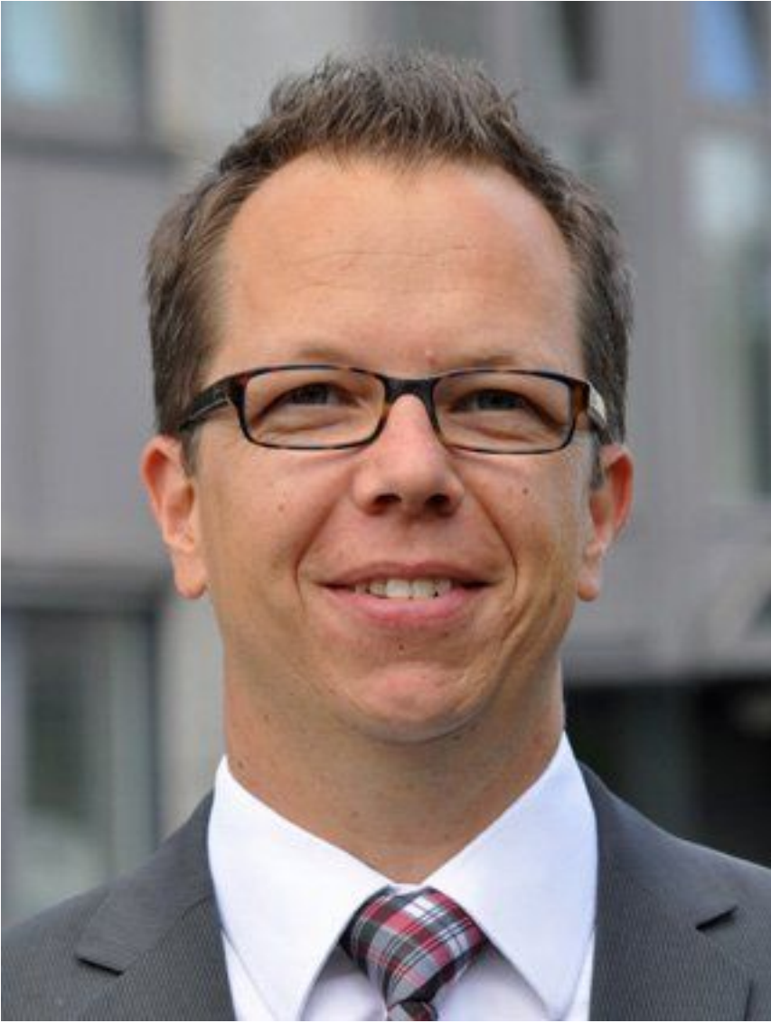
Michael Neuberg